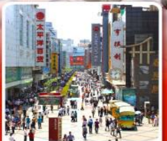
ช้อปปิ้งถนนคนเดินซุนซีอู่