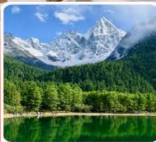
อุทยานบึงเพ็งโก