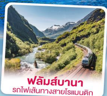
ฟลัมส์บานา รถไฟเส้นทางสายโรแมนติก

เริ่มต้น 92,900 แพ็คเกจเรือสำราญ DFDS 1 คืน ห้องพักรวมอาหารเช้าพร้อมสแกนดิเนเวียอนุฟูเฟ็ด