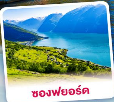
ช่องฟยอร์ด