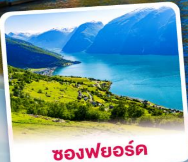
ช่องฟยอร์ด