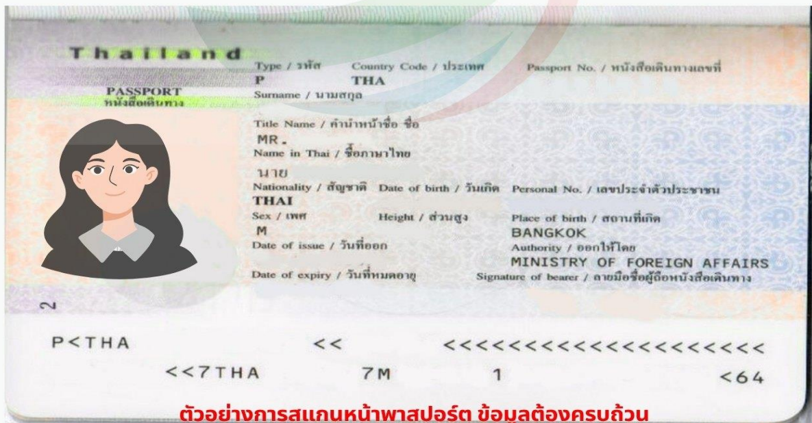
ตัวอย่างการสแกนหน้าพาสปอร์ต ข้อมูลต้องครบถ้วน ท่านสามารถสแกนส่งไฟล์ PDF หรือถ่ายรูปส่งแทนได้ ( รูปไม่เอียง ไม่ติดนิ้ว )

การพิจารณาวีซ่าเป็นดุลยพินิจของทางสถานทูตเท่านั้น ทางบริษัทเป็นผู้ดำเนินการเรื่องเอกสารและ อำนวยความสะดวก ซึ่งสามารถกรอกออนไลน์ได้ก่อนเดินทาง 30 วัน หรือหลังจากท่านชำระเงินงวด สุดท้าย ทั้งนี้หลังจากกรอกข้อมูลเข้าระบบแล้วใช้เวลาพิจารณา 7-15 วันทำการ กรณีวีซ่าท่านล่าช้า หรือถูกปฏิเสธและมีค่าใช้จ่ายเพิ่มเติม ทางบริษัทขอสงวนสิทธิ์เก็บตามค่าใช้จ่ายที่เกิดขึ้นจริง