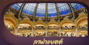
ลาฟาแยตต์