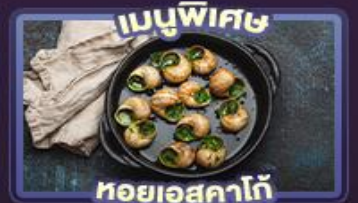
เมนูพิเศษ ทอยเอสคาโก้

ตั๋วเครื่องบินบรรณาการเมืองเซอร์แมท เยือนลูเซิร์นชมสะพานชาเปลและอนุสาวรีย์สิงโต เยือนมิลาโน สัมผัสความงดงามของคูโอโม และวิวโรมันติกริมทะเลสาบโคโม เช็คอินปารีส หอไอเฟล ประตูชัย พิพิธภัณฑ์ลูฟร์ ช้อปปิ้งจุดถนนฌ็องเซลิซ ลาฟาแยตต์ และเอาก์เล็ท