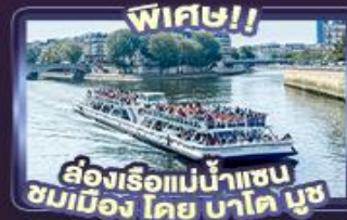
พิเศษ!! ล่องเรือแม่น้ำแซน ชมเมือง โดย บาโต มูซ