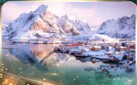
หมู่บ้านเรนเน

นอร์เวย์ แสงเหนือสุดฟิน เชคอินสุดว้าว 10 วัน 7 คืน