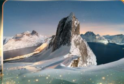
เกาะเซนญา