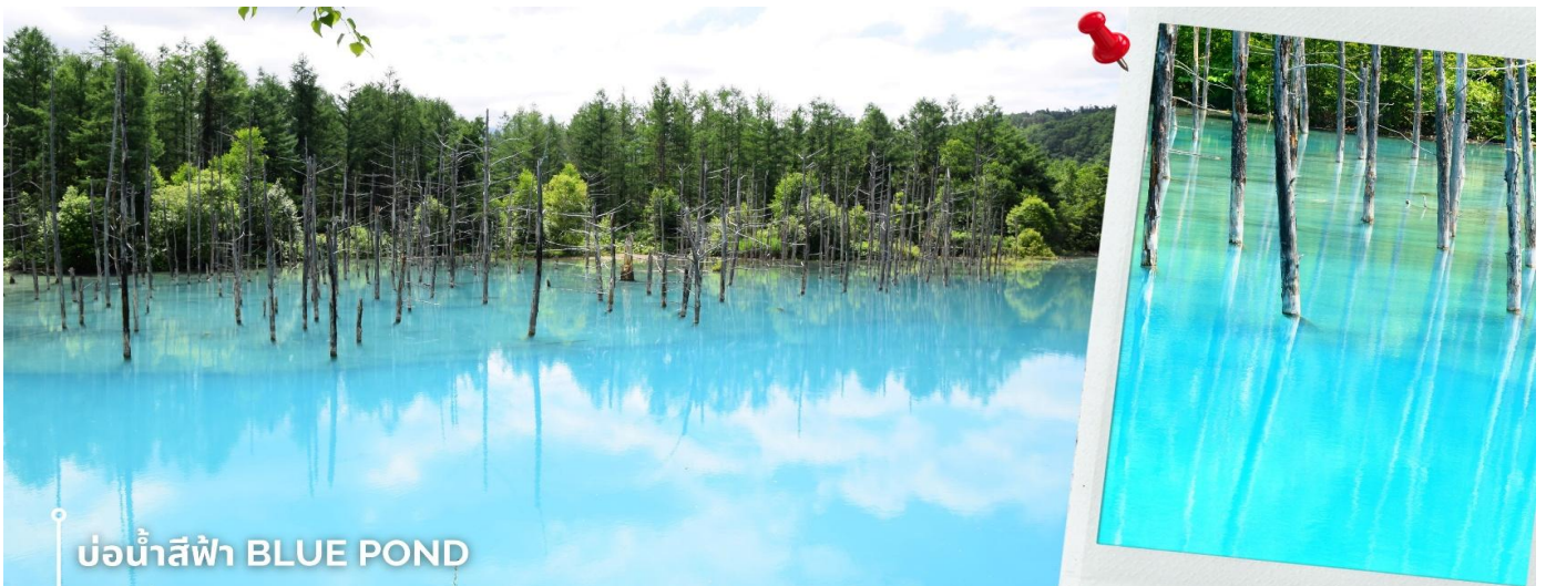
บ่อน้ำสีฟ้า BLUE POND

หลังรับประทานอาหารเที่ยง นำท่านเดินทางผ่านเมืองฟูราโนะ เป็นเมืองที่มีพื้นที่กว้างบนเนินเขาที่ทอดยาวไปยังภูเขาโทกาจิ โดยตั้งอยู่เลยแม่น้ำโซราจิ เนื่องจากมีที่ตั้งอยู่ที่ใจกลางฮอกไกโด ฟูราโนะจึงมีชื่อเล่นว่า เฮโซะ โนะ มาจิ หรือ “เมืองสะอาด” ให้ท่านได้ผ่านชมความสวยงามและความโรแมนติกของเมืองแห่งนี้ และเดินทางต่อไปยังเมืองบิเอะ เป็นเมืองที่ได้รับความนิยมทางด้านธรรมชาติแบบทุ่งกว้างและเนินเขา (ใช้เวลาเดินทางรวมประมาณ 2 ชั่วโมง) พาท่านชม บ่อน้ำสีฟ้า Blue Pond ที่ตั้งอยู่ที่เมืองบิเอะ เป็นบ่อน้ำที่กักไว้จากการสร้างเขื่อน สามารถป้องกันความเสียหายที่เกิดขึ้นจากโคลนถล่มบริเวณภูเขาไฟ เป็นบ่อน้ำที่น้ำจะมีสีฟ้าสดกว่าบ่อน้ำทั่วไปจนเป็นเอกลักษณ์ บริเวณบ่อน้ำจะมี ต้นไม้ที่อยู่ในน้ำ ซึ่งคือต้นลาร์ชและซิลเวอร์เบิร์ช และเนื่องจากภายในบ่อน้ำ มีอุณหภูมิไฮดรอกไซด์ที่เกิดจากการปะทุของภูเขาไฟที่อยู่ใต้น้ำสะท้อนกับแสงแดดที่ส่องลงมา ทำให้เกิดเป็นสีฟ้าที่สดและสวยงาม สีของสระจะไล่ระดับตั้งแต่สีเทอร์ควอยซ์ สีมรกต ไปจนถึงสีน้ำเงินโคบอลต์ ซึ่งเกิดขึ้นจากสิ่งเจือปนต่าง ๆ ในน้ำที่ไหลจากน้ำตกชิราอิเกะ ถุดุกาลและลม เมฆ ฝน ปัจจัยต่างๆเหล่านี้จะทำให้สีของสระเปลี่ยนแปลงได้ ท่านสามารถชมความงามของบ่อน้ำแห่งนี้ได้ตลอดทั้งปี ให้ท่านอิสระถ่ายภาพตามอัธยาศัย