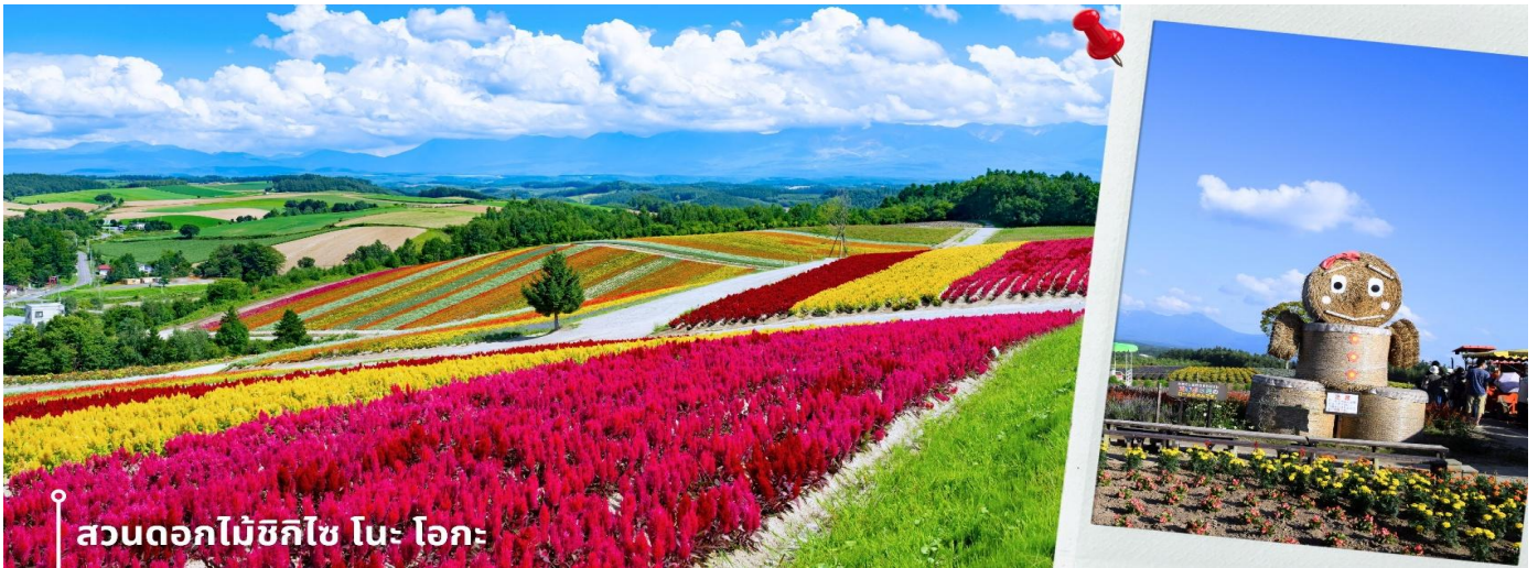
สวนดอกไม้ชิซึโนะ โอะกะ

หลังจากนั้นพาท่านเดินทางไปยัง อีออนมอลล์ AEON MALL ภายในตัวห้างมีร้านค้าต่างๆมากมาย ซึ่งตกแต่งในรูปแบบที่ทันสมัยสไตล์ญี่ปุ่นสินค้ามากมายหลากหลายให้เลือกตั้งแต่เสื้อผ้าแฟชั่นอาหารสดใหม่และอุปกรณ์ภายในบ้านรวมไปถึงเครื่องสำอาง ขนมญี่ปุ่นต่างๆและยังมีร้านค้ามากมายไม่ว่าจะเป็น Muji, 100 yen shop, Sanrio store, Capcom games arcade และก็ยังมีซูเปอร์มาร์เก็ตขนาดใหญ่ให้ท่านได้เลือกซื้อของช้อปปิ้งตามอัธยาศัย