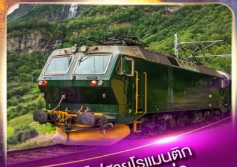
รถไฟสายโรเมนติก ฟลัมส์บาน่า