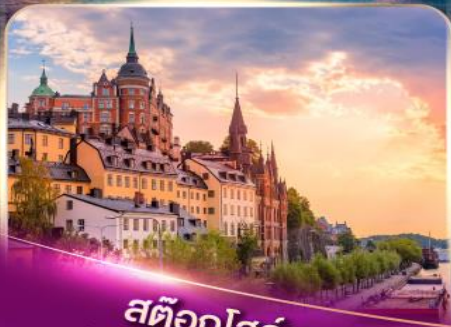
สต็อกโฮล์ม เวนิสแห่งยุโรปเหนือ