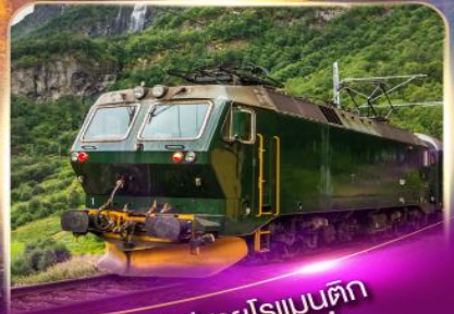
รถไฟสายโรเมนติก ฟลิมส์บานา