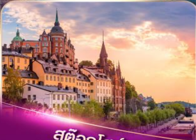
สต็อกโฮล์ม เวเนสแห่งยุโรปเหนือ