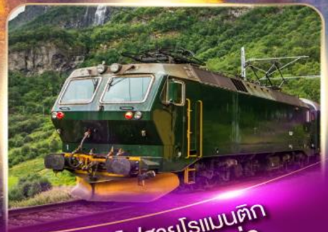
รถไฟสายโรแมนติก ฟลัมส์บาน่า