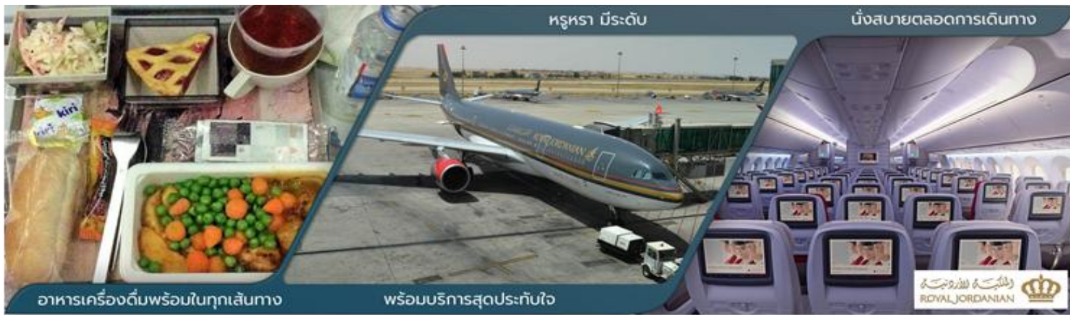
อาหารเครื่องดื่มพร้อมในทุกเที่ยวบิน