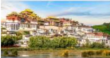
วัดลามะชงจันหลิน