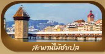
สะพานไมซ์าเปค