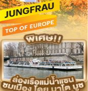
JUNGFRAU TOP OF EUROPE พิเศษ!! ล่องเรือแม่น้ำแซน ชมเมือง โดย บาโต บูช