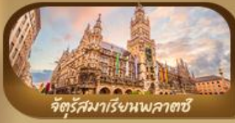
จัตุรัสมาเรียนพลาตซ์

24 ก.ย. - 1 ต.ค.68 / 1-8 ต.ค.68 / 21-28 ต.ค.68