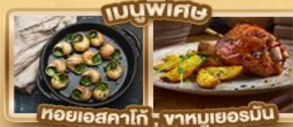
เมนูพิเศษ หอยเอสคาโก้, หมูเยอรมัน

มิวนิค ปราสาทนอยชวานชไตน์ จุงเฟรา ลูเซิร์น สตราสบูร์ก ปารีส