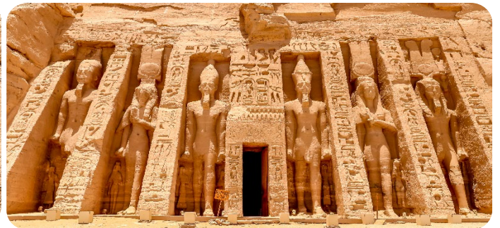
สมควรแก่เวลานำท่านเดินทางกลับเมืองอัสวาน