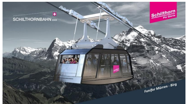
Funifor Mürren - Birg

Highlight! ในวันที่ฟ้าเปิด จะสามารถเห็นยอดเขากว่า 200 ยอด ซึ่งถือว่าเป็นภาพวิวที่หาดูได้ยากมากๆ !!!