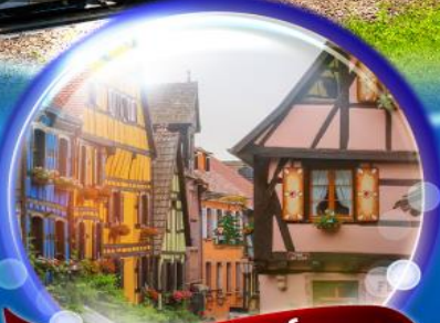
ริคเวียร์