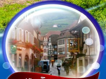
หมู่บ้านริเบอร์วิลส์