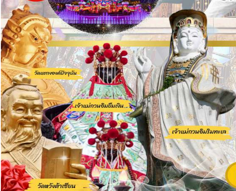
วัดแห่งองค์ปัจจุบัน