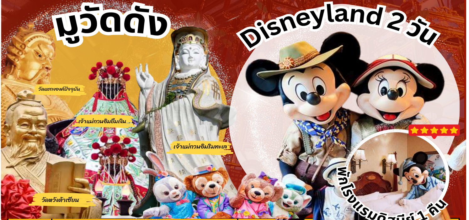
วัดแห่งองค์ปัจจุบัน