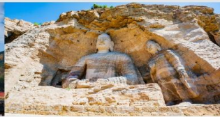
กำแพงแกะสลักหยุดยั้ง