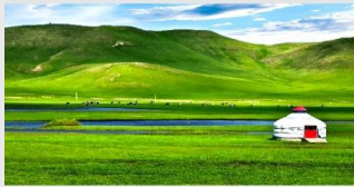
ทุ่งหญ้าซิลามู่เหริน