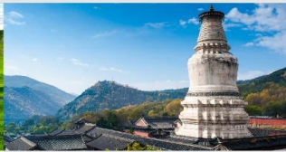
ภูเขาอูโตซาน