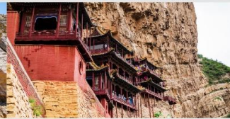
อารามลอยฟ้าเสวียนคง

*ทางบริษัทฯ ขอสงวนสิทธิ์ในการสลับโปรแกรมทัวร์ตามความเหมาะสมขึ้นอยู่กับสถานการณ์หน้างาน โดยคำนึงถึงผลประโยชน์ของลูกค้าเป็นสำคัญ