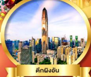
ตึกผิงอัน