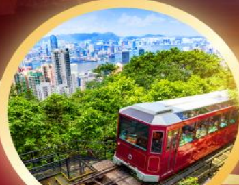
วิคตอเรียพีก