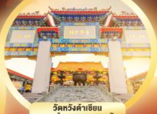
วัดหวังต้าเซียน ขอพรด้านสุขภาพ ความรัก