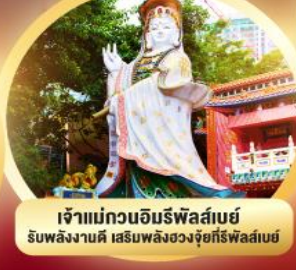
เจ้าแม่กวนอิมรพีลาสเบย์ รับพลังงานดี เสริมพลังดวงใจที่รพีลาสเบย์