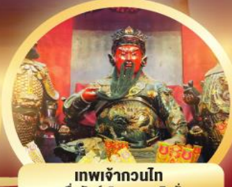
เทพเจ้ากวนไท ความซื่อสัตย์ เงินทอง ธุรกิจมั่นคง