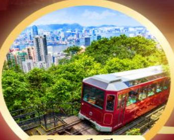
วิคตอเรียพีค