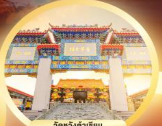
วัดหวังต้าเซียน ขอพรด้านสุขภาพ ความรัก