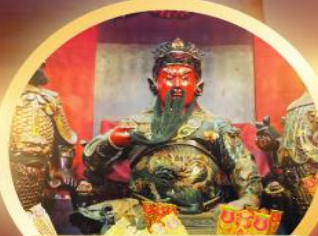
เทพเจ้ากวนไท ความซื่อสัตย์ เงินทอง ธุรกิจมั่นคง