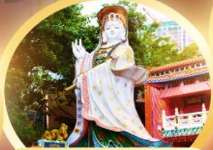
เจ้าแม่กวนอิมรพีลัสเบย์ รับพลังงานดี เสริมพลังดวงใจที่รพีลัสเบย์