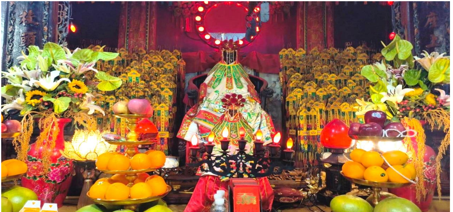
GO1HKG-EK059 เส้นทางเศรษฐกิจ ศรีเทพาเฮง ฮ่องกง เปิดท้องพระคลังเจ้าแม่กวนอิมฮ่องกง 3 วัน 2 คืน โดยสายการบิน Emirates (EK)

อัตราค่าบริการสำหรับ เด็กอายุไม่เกิน 2 ปี ณ วันเดินทางกลับ (Infant) ท่านละ 6,900 บาท ** อัตรานี้ไม่รวมค่าทิปคนขับรถ และมัดคฤเทศก์ท้องถิ่น ท่านละ 1,500 บาท/ท่าน **