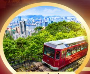
วิคตอเรียพีค