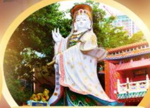
เจ้าแม่กวนอิมรพีลัสเบย์ รับพลังงานดี เสริมพลังดวงใจที่รพีลัสเบย์