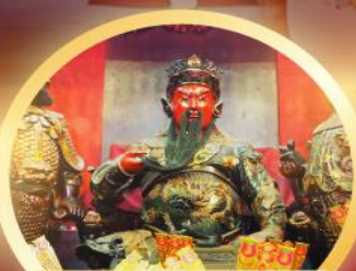
เทพเจ้ากวนไท ความซื่อสัตย์ เงินทอง อุดหนุนมั่นคง