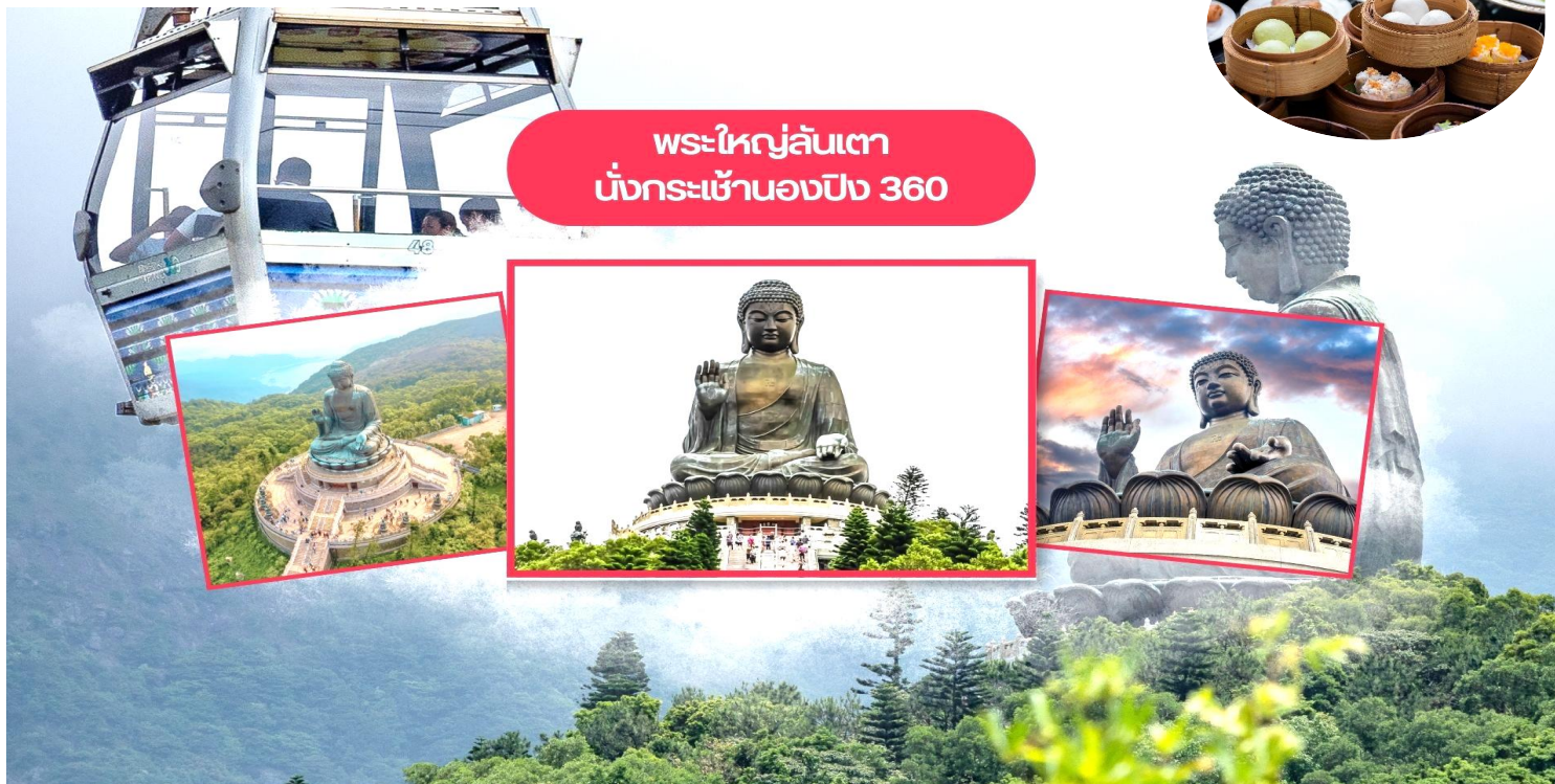
พระใหญ่ลันเตา นั่งกระเช้านงปิง 360

นำท่านเดินทางสู่ เกาะลันเตา สถานีตงซุง นำท่าน ขึ้นกระเช้านงปิง 360 (Ngong Ping 360) ชมวิวมุมกว้าง 360 องศา รวมค่ากระเช้า ตลอดระยะทางทั้งหมด 5.7 กิโลเมตร (ในกรณีที่กระเช้านงปิงปิด ทางบริษัทฯ ขอสงวนสิทธิ์นำท่านขึ้นชมโดยรถบัลแทน) นำท่านสักการะขอพร พระใหญ่เทียนถาน หรือ พระใหญ่เกาะลันเตา ณ ลานอธิษฐาน พระพุทธรูปทองสัมฤทธิ์อันศักดิ์สิทธิ์ของฮ่องกง และเป็นพระพุทธรูปกลางแจ้งที่ใหญ่ที่สุดในโลกองค์พระทำขึ้นจากการเชื่อมแผ่นทองสัมฤทธิ์กว่า 200 แผ่นเข้าด้วยกันหันพระพักตร์ไปทางด้านทะเลจีนใต้และมองอย่างสงบลงมายังหุบเขา และโชดหินเบื้องล่าง ให้ท่านชมความงดงามตามอัธยาศัย