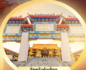
วัดหวังต้าเซียน ขอพรด้านสุขภาพ ความรัก