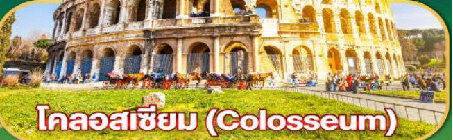
โคลอสเซียม (Colosseum)