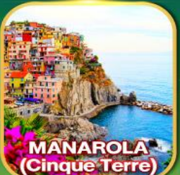
MANAROLA (Cinque Terre)