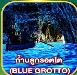
ถ้ำบลูกรอตโต (BLUE GROTTO)