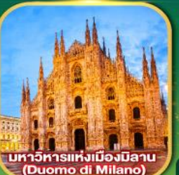
มหาวิหารแห่งเมืองมิลาน (Duomo di Milano)