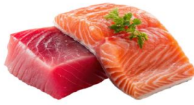
● ไส้ทานปลาดิบ