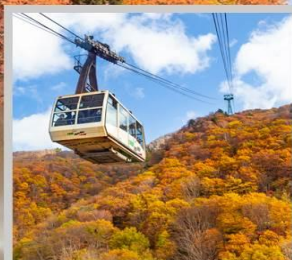
“ZAO CHUO ROPEWAY”