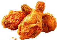
● ไส้ทานสัตว์ปีก (ไก่)