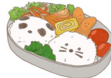
● อาหารสำหรับเด็ก ( 2-11 ปี ) *วัตถุประสงค์ขึ้นอยู่กับทาว์ราน