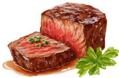
● ไส้ทานเนื้อวัว

ขอความกรุณาแจ้งวัตถุประสงค์ที่ท่าน แพ้หรือไม่สามารถรับประทานได้