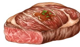
● ไส้ทานเนื้อหมู