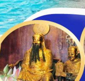
วัดกวนโก ขอพรแก่พระเจ้ากวนอูช่วยเสริมอำนาจการมี