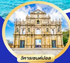
วิหารเซนต์ปอล