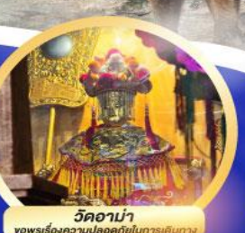
วัดอาณา ขอพรเรื่องความปลอดภัยในการเดินทาง