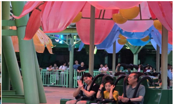
GO1MFM-NX017 มาเก๊า จูโหล่ สวนสนุก Chimelong Ocean Kingdom ดูฉลามวาฬยักษ์ ส่องน้องหมีขั้วโลก ชมโชว์วาฬเบลูก้า 3 วัน 2 คืน *ไม่ลงร้าน* โดยสายการบิน AIR MACAU (NX)