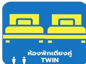
ห้องพักเตียงคู่ TWIN