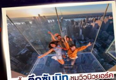
ชั้น ดิกซิมมิก เซนทรัลนิวยอร์ก

ล่องเรือชมน้ำตกไนแอกการ่าฝั่งแคนาดา และเดินเนอร์บนหอคอยสกายลอน