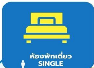
ห้องพักเดี่ยว SINGLE

ตัวอย่างประเภทห้องพัก *เป็นเพียงตัวอย่างเพื่อให้เห็นภาพสำหรับประเภทห้องในแบบต่างๆ