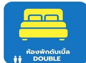
ห้องพักดับเบิล DOUBLE