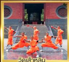
วัดเจ้าหลิน