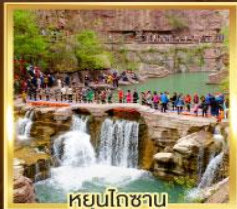
หยุ่นโกซาม