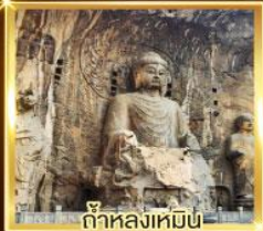
ถ้ำหลงเหมิน