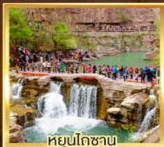
หยุนโกซาม