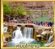
หยุ่นโกซาม