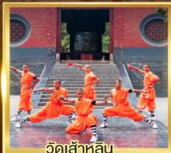
วัดสำหลิน