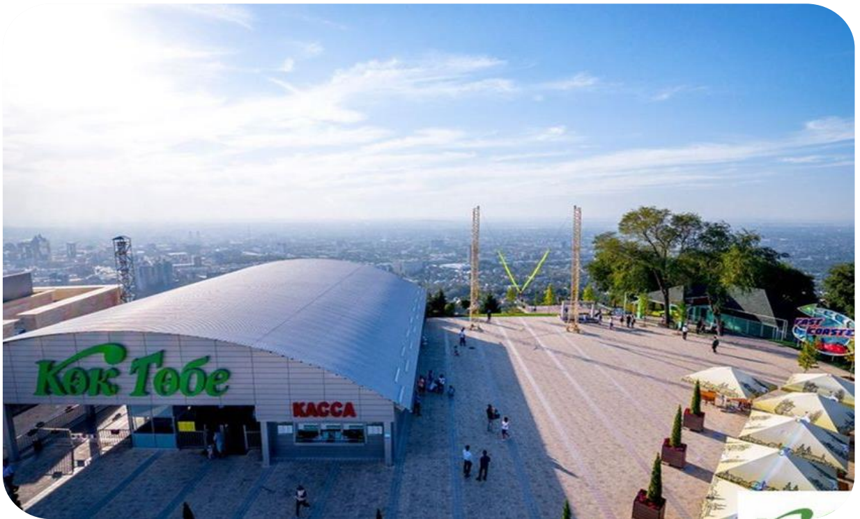
หน้า 12 (ภาพใช้เพื่อควารโฆษณาเท่านั้น)

จากนั้นนำท่านสู่ จุดชมวิวเขาค็อกโทเบ (Kok-Tobe) ค็อกโทเบเป็นภูเขาที่มีความสูงเหนือระดับน้ำทะเล 1,100 เมตร และเป็นพื้นที่สันตนาการที่สำคัญที่สุดแห่งหนึ่งของอัลมาตี มีกิจกรรมเพื่อการหย่อนใจ หลากหลายไม่ว่าจะเป็นร้านค้า ร้านอาหาร สวนสนุก รวมถึงเป็นจุดชมวิวมืองอัลมาตีในมุมสูงที่สวยงามที่สุด เป็นที่ตั้งของหอส่งสัญญาณโทรทัศน์ที่มีความสูงถึง 372 เมตร จึงสามารถมองเห็นได้จากแทบทุกจุดในตัวเมืองอัลมาตี (รวมค่าขึ้น Cable Car)