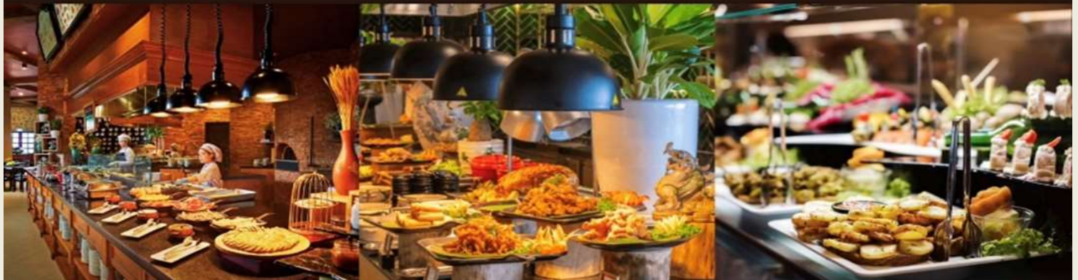
หน้า 5 (ภาพใช้เพื่อการโฆษณาเท่านั้น)