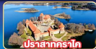
ปราสาทคราโด

พิเศษ! เที่ยวเก็บครบทุกประเทศยุโรปเหนือ ลิทัวเนีย , ลัตเวีย , เอสโตเนีย , ฟินแลนด์