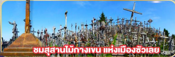
ชมสุสานไม้กางเขน แห่งเมืองซิวเลย์