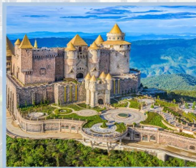
ปราสาทจันกรา