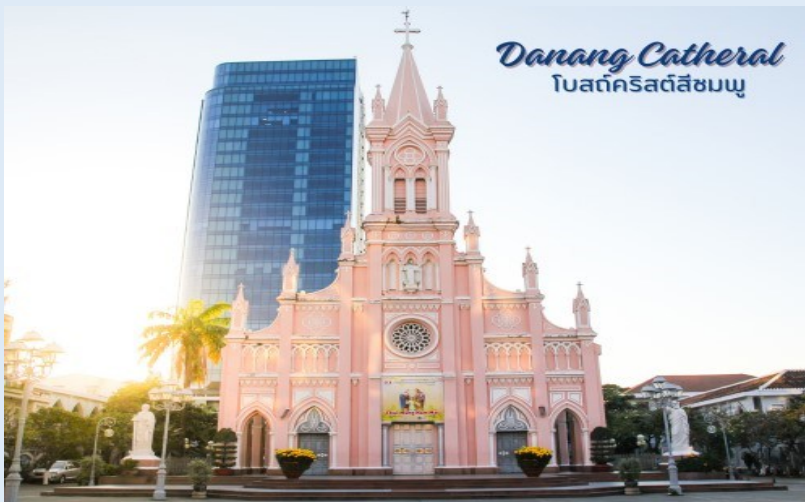
Danang Cathedral โบสถ์คริสต์สีชมพู

นำท่านถ่ายรูป โบสถ์คริสต์ดานัง หรือโบสถ์คริสต์สีชมพู (Danang Cathedral) สร้างขึ้นสมัยเวียดนาม ตกเป็นอาณานิคมของฝรั่งเศส สถาปัตยกรรมสไตล์โกธิก ยตกแต่งด้วยความประณีตสวยงาม ตัวโบสถ์เป็นสีชมพูทั้งหลัง ตัดขอบด้วยสีขาว เป็นอีกหนึ่งสถานที่ที่ไม่ควรต้องพลาดเมื่อมาเยือนเมืองดานัง จากนั้น อิสระช้อปปิ้ง ตลาดฮาน อิสระเลือกซื้อสินค้าหลากหลายชนิด เช่นผ้า เหล้า บุหรี่ และของกินต่างๆ เป็นตลาดสดและขายสินค้าพื้นเมืองของเมืองดานัง