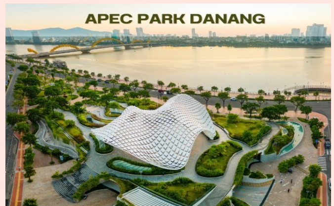
APEC PARK DANANG

นำท่านแวะ ร้านหยกและอัญมณี อิสระในการเลือกซื้อเครื่องประดับต่างๆ เช่น แหวน สร้อยคอ สร้อยข้อมือ จี้ เป็นต้น