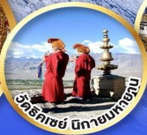
วัดธิกาชย์ นิกายนิกายลามะ