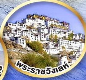
พระราชวังเลห์