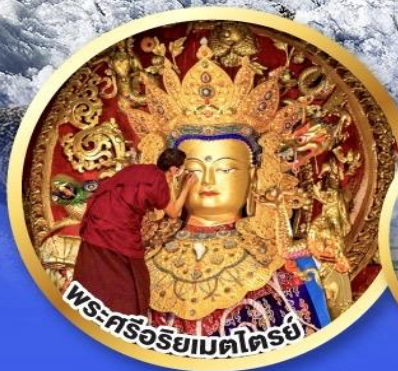
พระศรีอริยเมตไตรย์