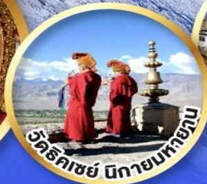
วัดริคเซย์ นิกายนิกายทิเบต