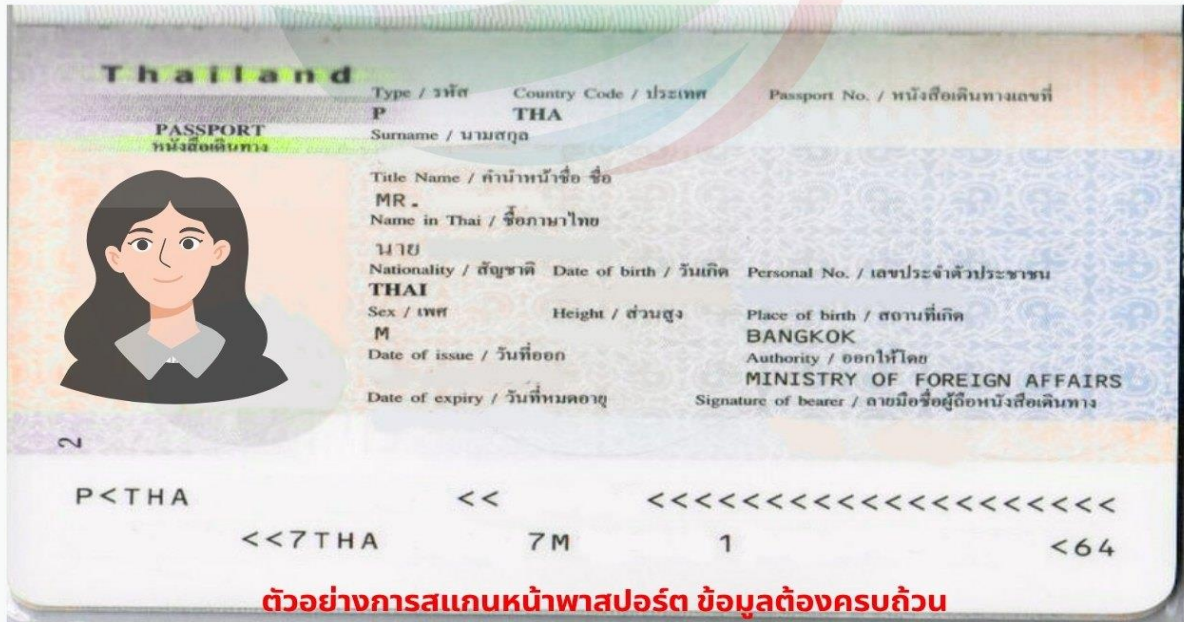
ตัวอย่างการสแกนหน้าพาสปอร์ต ข้อมูลต้องครบถ้วน ท่านสามารถสแกนส่งไฟล์ PDF หรือถ่ายรูปส่งแทนได้ ( รูปไม่เอียง ไม่ติดนิ้ว)

การพิจารณาวีซ่าเป็นดุลยพินิจของทางสถานทูตเท่านั้น ทางบริษัทเป็นผู้ดำเนินการเรื่องเอกสารและอำนวยความสะดวก ซึ่งสามารถกรอกออนไลน์ได้ก่อนเดินทาง 30 วัน หรือหลังจากท่านชำระเงินงวดสุดท้าย ทั้งนี้หลังจากกรอกข้อมูลเข้าระบบแล้วใช้เวลาพิจารณา 7-15 วันทำการ กรณีวีซ่าท่านล่าช้าหรือถูกปฏิเสธและมีค่าใช้จ่ายเพิ่มเติม ทางบริษัทขอสงวนสิทธิ์เก็บตามค่าใช้จ่ายที่เกิดขึ้นจริง