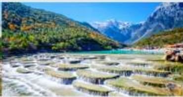
ทะเลสาบไปสุ่ยเหอ