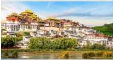
วัดลามะชงจันหลิน