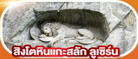
สิงโตหินแกะสลัก ลูซิร์น

พีชียอดเขาจุงเฟรา ขึ้นกระเช้าชมยอดเขาแมทเทอร์ฮอร์น