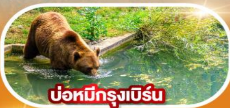
บ่อหมีกรุงเบียร์