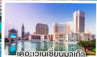
เดอะเวเนเซียนมาเก๊า