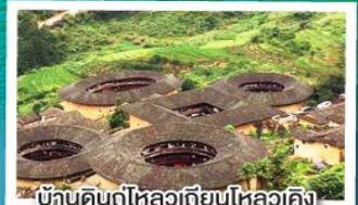
บ้านดินกู่ไหลวเทียนไหลวคิง