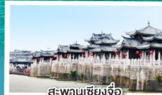
สะพานเซียงจิว