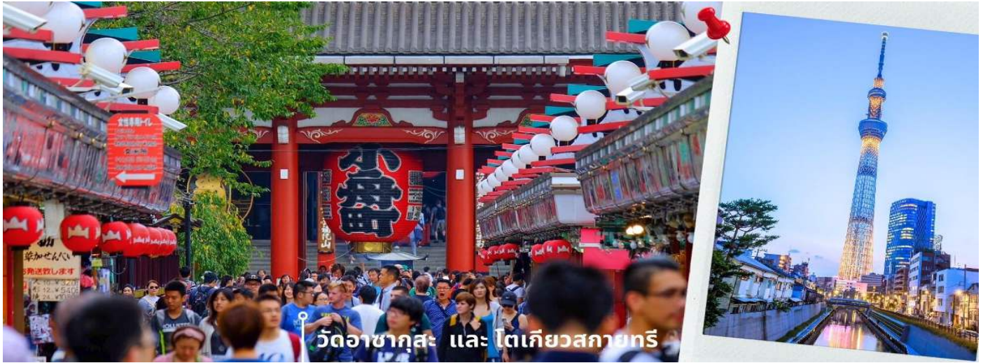
วัดอาซากุสะ และ โตเกียวสกายทรี

พอสมควรแก่เวลา พาท่านเดินทางเข้าสู่ย่าน ช้อปปิ้งชินจูกุ Shinjuku แหล่งช้อปปิ้งชื่อดังในโตเกียวให้ท่านอิสระและเพลิดเพลินกับการช้อปปิ้งสินค้ามากมายทั้งเครื่องใช้ไฟฟ้ากล้องถ่ายรูปดิจิตอลนาฬิกา เครื่องเล่นเกมส์ หรือสินค้าที่จะเอาใจคุณผู้หญิงด้วยกระเป๋า รองเท้า เสื้อผ้าแบรนด์เนม เสื้อผ้าแฟชั่นสำหรับวัยรุ่น เครื่องสำอางยี่ห้อดังของญี่ปุ่นไม่ว่าจะเป็น KOSE, KANEBO, SK II, SHISEDO และอื่นๆอีกมากมาย