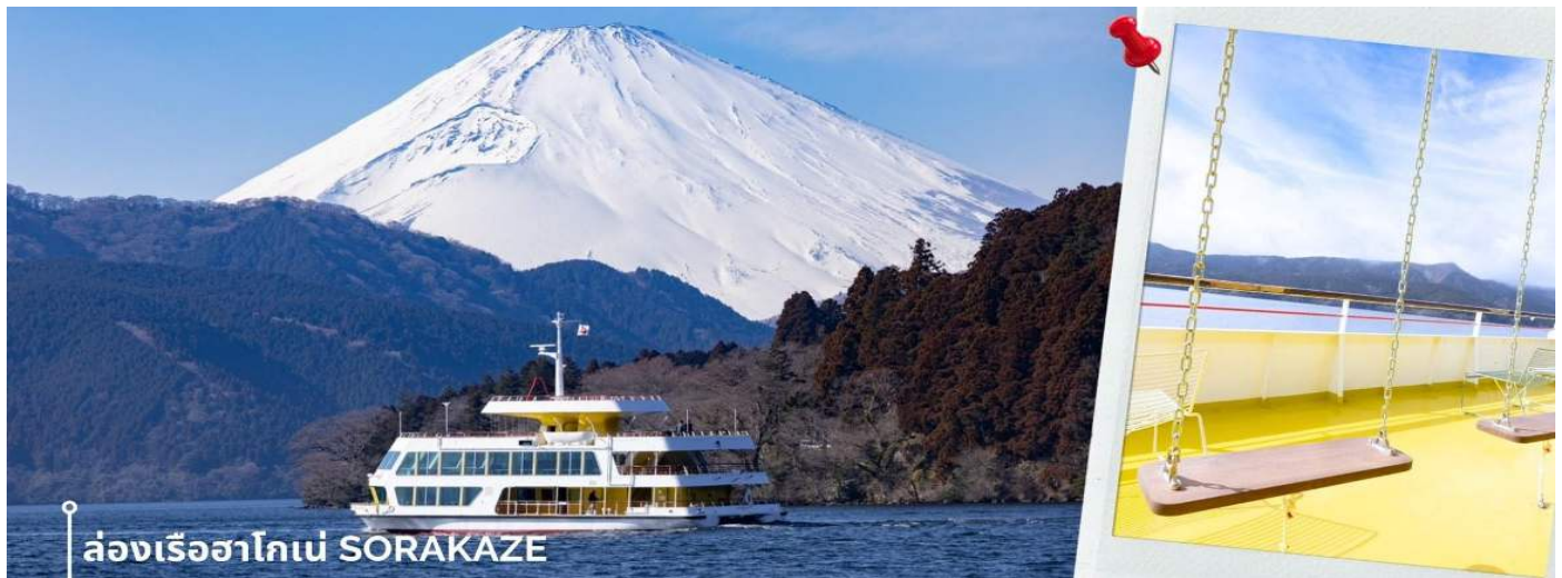
**การมองเห็นวิวภูเขาไฟฟูจิขึ้นอยู่กับสภาพอากาศ**

หลังรับประทานอาหารเที่ยง พาท่านเดินทางสู่ ทะเลสาบอาชิ ซึ่งเป็นทะเลสาบที่ล้อมรอบไปด้วยธรรมชาติที่อุดม สมบูรณ์และวิวภูเขาฟูจิ เป็นหนึ่งในทะเลสาบที่สวยงามที่สุดในญี่ปุ่น ในประวัติศาสตร์เชื่อกันว่าทะเลสาบแห่งนี้เกิดขึ้นจาก การประทุของภูเขาไฟเมื่อประมาณ 3100 ปีก่อน ปัจจุบันเป็นแหล่งท่องเที่ยวในฮาโกเน่ พาท่าน ล่องเรือฮาโกเน่ SORAKAZE โดยเรือลำนี้ได้มีการรีโนเวทใหม่!! ในชื่อ Hakone Maru และมีการปรับปรุงปลั๊กชมเรือลำใหม่ โดย ออกแบบเรือให้มีความเป็นมิตรต่อสิ่งแวดล้อมและเข้ากันกับทิวทัศน์ที่สวยงามของภูเขาไฟฟูจิ รวมถึงใช้เชือกมกมล Mizuhiki ตัดเป็นรูปร่างนกกระเรียน ซึ่งเป็นอัตลักษณ์สำคัญที่สะท้อนถึงความเป็นญี่ปุ่น ภายในห้องโดยสารชั้น 2 ถูก ออกแบบมาให้สามารถชมบรรยากาศภายนอกได้อย่างชัดเจนด้วยกระจกบานใหญ่ ชั้นบนถูกแต่งให้เหมือน สวนสาธารณะ ทั้งกระถางต้นไม้ ม้านั่ง ชิงช้า ให้ท่านได้ชมวิวทิวทัศน์และธรรมชาติรอบๆทะเลสาบ และในวันที่ฟ้าเปิด ยังสามารถมองเห็นฟูจิซังจากตรงนี้ได้อีกด้วย โดยจะล่องจากท่าเรือ HAKONE SEKISHO - ท่าเรือ MOTOHAKONE ก่อนจะพาท่านขึ้นฝั่ง