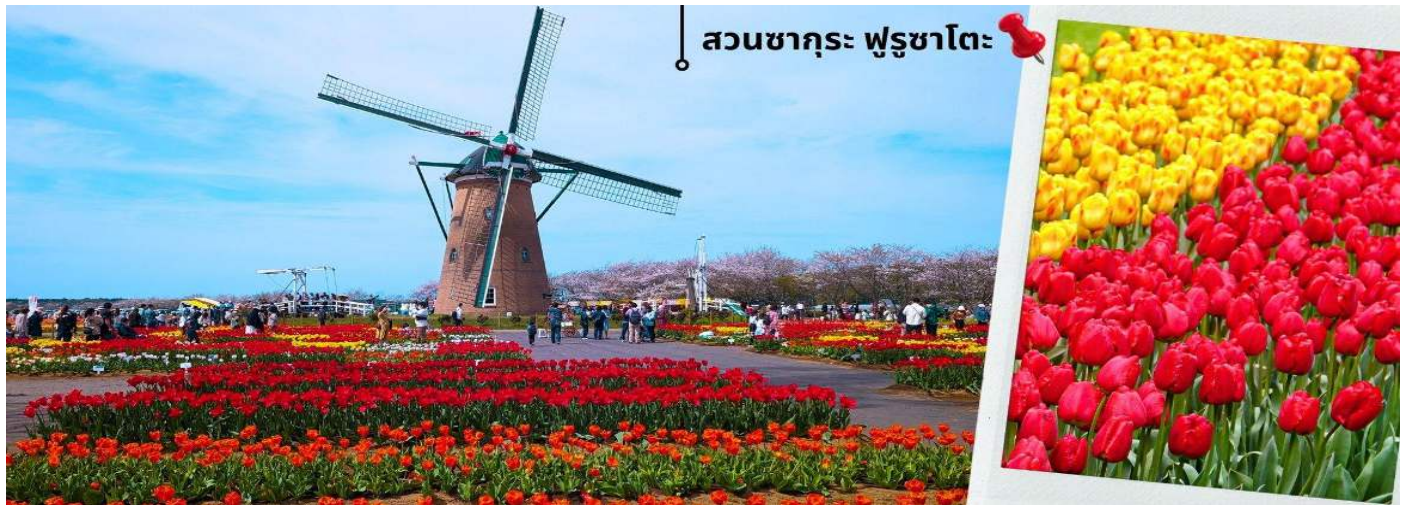
สวนซากุระ ฟุรุซาโตะ

หลังรับประทานอาหารเช้า นำท่านเดินทางชมเทศกาลดอกไม้ที่ สวนซากุระ ฟุรุซาโตะ Sakura Furusato square เป็นสวนสาธารณะริมทะเลสาบที่มี สวนดอกทิวลิปและกังหันลมสไตล์เนเธอร์แลนด์ ที่สร้างขึ้นเป็นที่แรกของญี่ปุ่น อยู่ที่จังหวัดชิบะ สวนแห่งนี้จะมีการจัดงานเทศกาลสวนดอกทิวลิปหลากสีสัน มากกว่า 7 แสนต้น รวมแล้วกว่า 100 สายพันธุ์ ทำให้ที่นี่เป็นทุ่งดอกทิวลิปที่ใหญ่ที่สุดในประเทศญี่ปุ่น นอกจากทุ่งดอกทิวลิปแล้ว ที่สวนซากุระ ฟุรุซาโตะ (Sakura Furusato) ยังมีทุ่งดอกไม้ให้ชมอีกหลายชนิดตามฤดูกาล นั้นๆ เช่น ดอกคอสมอส ดอกป๊อปปี้ และดอกทานตะวัน เป็นต้น และภายในสวนยังมีร้านขายของฝาก และร้านค้าร้านอาหารต่างๆให้ท่านได้อิสระเลือกทาน และได้ถ่ายรูปเก็บภาพความประทับใจตามอัธยาศัย