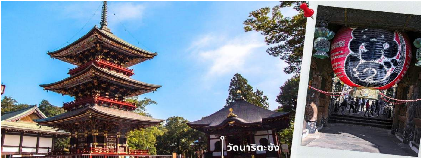
วัดนาริตะซัง

จากนั้นนำท่านเดินทางไปยัง AEON MALL ภายในตัวห้างมีร้านค้าต่างๆมากถึง 150 ร้านซึ่งตกแต่งในรูปแบบที่ทันสมัย สไตล์ญี่ปุ่นสินค้ามากมายหลากหลายให้เลือกตั้งแต่เสื้อผ้าแฟชั่นอาหารสดใหม่และอุปกรณ์ภายในบ้านรวมไปถึง เครื่องสำอางค์ขนมญี่ปุ่นต่างๆและยังมีร้านค้ามากมายไม่ว่าจะเป็น Muji, 100 yen shop, Sanrio store, Capcom games arcade และก็ยังมิซูเปเปอร์มาร์เก็ตขนาดใหญ่ให้ท่านได้เลือกซื้อของ