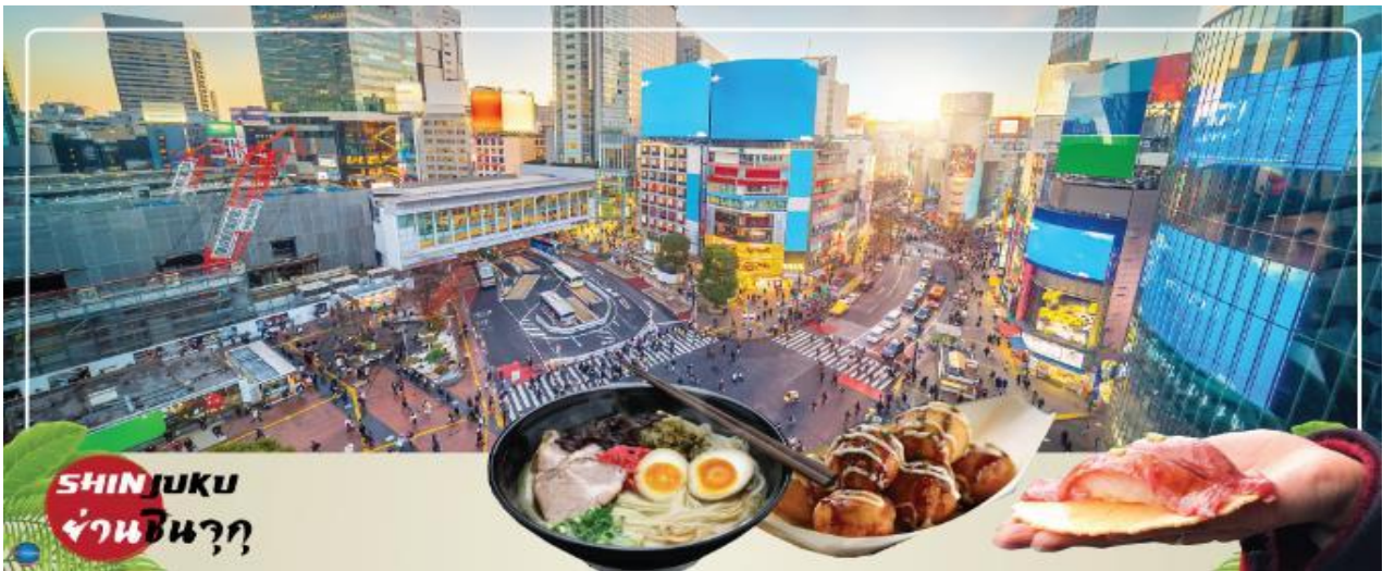
SHINJUKU ย่านชินจูกุ

นำท่านช้อปปิ้ง ย่านชินจูกุ (Shinjuku) ให้ท่านอิสระและเพลิดเพลินกับการช้อปปิ้งสินค้ามากมาย ทั้งเครื่องใช้ไฟฟ้า กล้องถ่ายรูปดีจิดอล นาฬิกา เครื่องเล่นเกม หรือสินค้าที่จะเอาใจคุณผู้หญิงด้วย กระเป๋า รองเท้า เสื้อผ้า แบรินต์เนม เสื้อผ้าแฟชั่นสำหรับวัยรุ่น เครื่องสำอางยี่ห้อดังของญี่ปุ่นไม่ว่าจะเป็น KOSE, KANEBO, SK II, SHISEDO และอื่นๆ อีกมากมาย ห้ามพลาด!!! จุดเช็คอินแห่งใหม่ ของชาวโซเชียล นั่นก็คือ แมวยักษ์ 3 มิติ ที่โผล่บนจอแอลอีดีมีขนาดมหึมา จอมีความโค้งขนาด 154 ตารางเมตร (1,664 ตารางฟุต) เสียงที่ออกจากลำโพงคุณภาพเกรดดี ความละเอียดภาพระดับ 4K ถือเป็นเทคโนโลยีระดับสูง ที่ให้ภาพเสมือนจริงปรากฏเป็นภาพแมวเหมียวเดินเล่นไปมาอยู่เหนือกรุงโตเกียว นอกจากแมวยักษ์แล้ว ท่านยังสามารถรับชมโฆษณาต่างๆ ที่ถูกครีเอทให้เป็นภาพ 3 มิติ ผ่านจอแอลอีดีนี้ ไม่ว่าจะเป็น แพนด้า, รองเท้าไนกี้, น้องหมา Pompompurin, จานบิน UFO แม้แต่หุ่นยนต์เครื่องดูดฝุ่น ท่านสามารถรับชมและเก็บภาพได้ตามอัธยาศัย