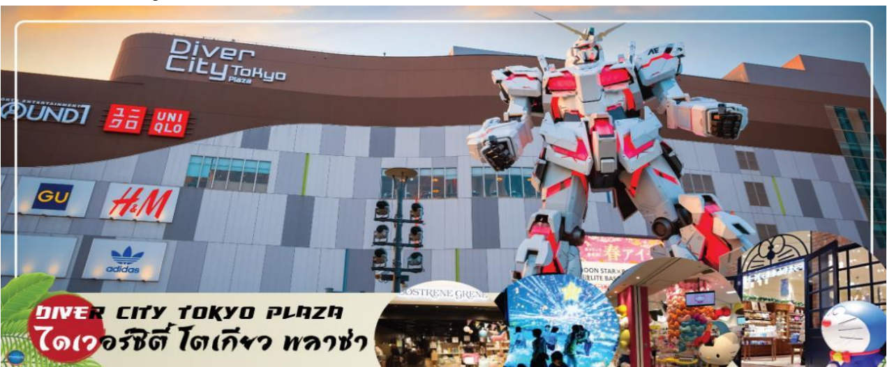
DIVER CITY TOKYO PLAZA ไดเวอร์ซิตี โตเกียว พลาซ่า

จากนั้นเดินทางสู่ ย่านโอไดบะ (Odaiba) เมืองคือเกาะที่สร้างขึ้นไว้เป็นแหล่งช้อปปิ้ง และแหล่งบันเทิงต่างๆ ในอ่าวโตเกียว ได้รับการปรับปรุงให้มีชื่อเสียงและเป็นที่นิยมในช่วงหลังของปี 1990 นอกจากนี้มีสถาปัตยกรรมที่สวยงามตั้งอยู่มากมายแล้ว แต่ก็ยังคงความเป็นธรรมชาติไว้ด้วยความอุดมสมบูรณ์ของพื้นที่สีเขียว ไดเวอร์ซิตี โตเกียว พลาซ่า (Diver City Tokyo Plaza) เป็นห้างดังอีกแห่งหนึ่ง ที่อยู่บนเกาะ โอไดบะ จุดเด่นของห้างนี้ก็คือ หุ่นยนต์กันดั้ม ขนาดเท่าของจริง ซึ่งมีขนาดใหญ่มาก ในบริเวณห้าง อิสระช้อปปิ้งตามอัธยาศัย