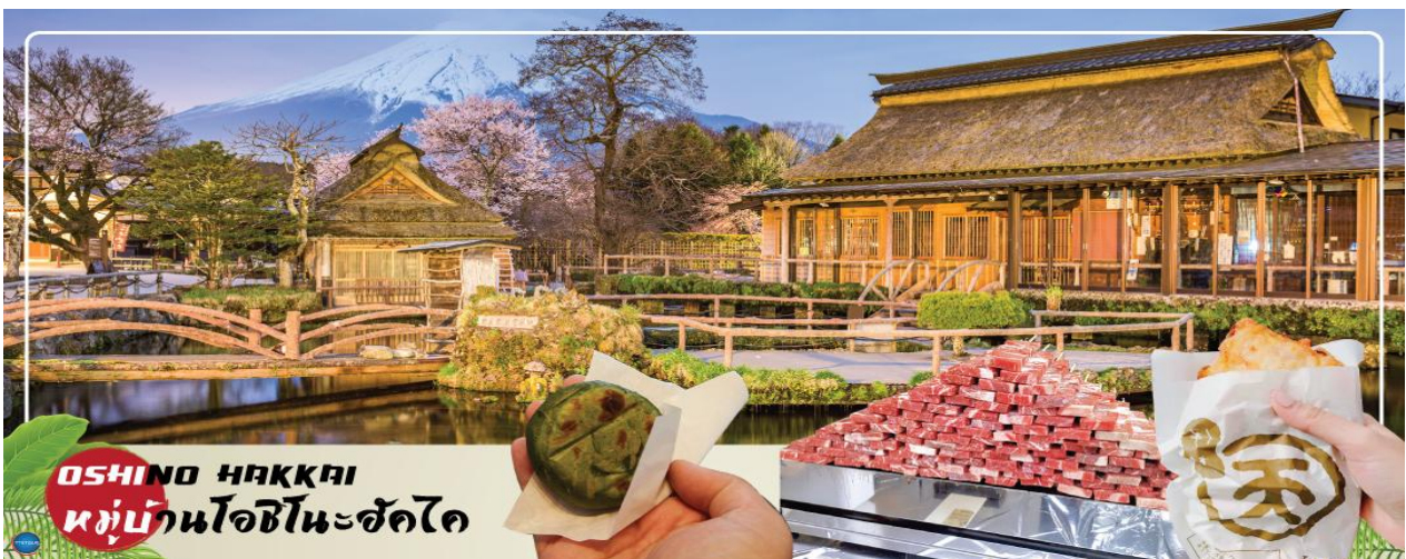
OSHINO HAKKAI หมู่บ้านโอชิโนะฮัคไค

ได้เวลาอันสมควรนำท่านเดินทางสู่ หมู่บ้านโอชิโนะฮัคไค (Oshino Hakkai) ให้ท่านเจาะลึกตามหาแหล่งน้ำบริสุทธิ์จากภูเขาไฟฟูจิ ที่เป็นแหล่งน้ำตามธรรมชาติตั้งอยู่ในหมู่บ้านโอชิโนะ จ.ยามานาชิ หรือพูดในทางกลับกันคือกลุ่มน้ำผุดโอชิโนะฮัคไค เพียงก้าวแรกที่ย่างเท้าเข้าไปในหมู่บ้านก็สัมผัสได้ถึงอากาศบริสุทธิ์ และไอเย็นจากแหล่งน้ำธรรมชาติที่มีให้เห็นอยู่ทุกมุม โดยในบ่อน้ำใสแจ๋วมีปลาหลากหลายพันธุ์แหวกว่ายอย่างสบายอารมณ์ แต่ขอบอกเลยว่าน้ำแต่ละบ่อนั้นเย็นจับใจจนแอบสงสัยว่าน้องปลาไม่หนาวสะท้านกันบ้างหรือ เพราะอุณหภูมิในน้ำเฉลี่ยอยู่ที่ 10-12 องศาเซลเซียสนอกจากชมแล้วก็ยังมีน้ำผุดจากธรรมชาติให้ดื่กดื่มตามอัธยาศัย และที่สำคัญ หมู่บ้านโอชิโนะยังเป็นแหล่งช้อปปิ้งสินค้าโอท็อปชั้นเยี่ยมอีกด้วย