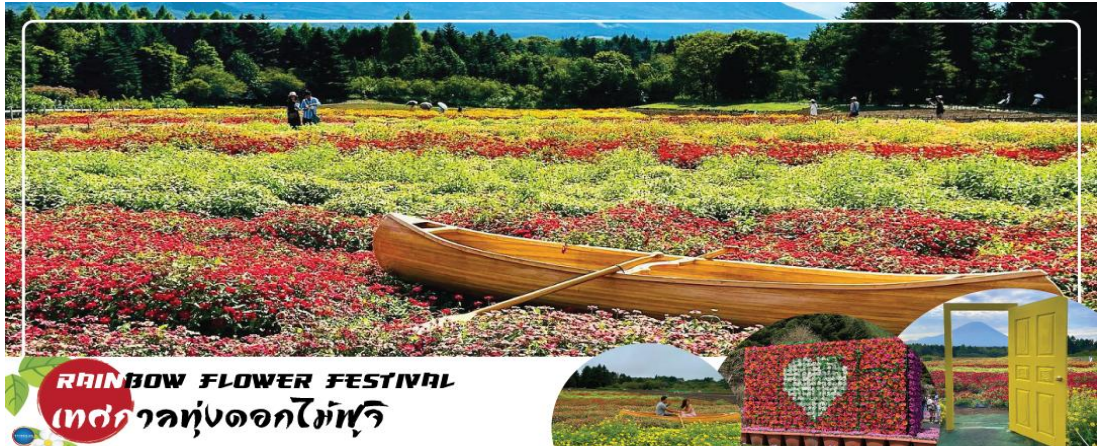
RAINBOW FLOWER FESTIVAL เทศกาลทุ่งดอกไม้ฟูจิ

หรือ ชม Rainbow Flower Festival 2025 (ปกติเทศกาลจะจัดช่วง ปลายเดือนสิงหาคม - ต้นเดือนตุลาคม ซึ่งกำหนดการปีนี่ยังไม่มีประกาศอย่างเป็นทางการ) สถานที่จัดงานบริเวณคาวากุจิโกะ เมืองแห่งภูเขาไฟฟูจิ เทศกาลดอกไม้เมืองร้อนที่มีชื่อเสียงของญี่ปุ่น ที่มีเพียงปีละครั้งเท่านั้น ภายในเทศกาลมีการจัดแสดงดอกไม้เมืองร้อนหลากหลายกว่า 10 ชนิด ไม่ว่าจะเป็น ดอกมิโกเนีย, ดอกซินเนีย, ดอกซัลเวีย และดอกรัตเบเกีย นอกจากนี้ยังสามารถมองเห็นวิวของภูเขาไฟฟูจิได้อีกด้วย ภายในสวนมีจุดให้ถ่ายรูปมากมาย และยังมีสวนดอกไม้สไลด์อังกฤษที่มาพร้อมตัวละครมาสคอตสุดน่ารัก "Piter Rabbit English Gardent" และนอกจากนี้ยังมีคาเฟ่ไว้นั่งพักผ่อนชมวิวแบบชิๆอีกด้วย