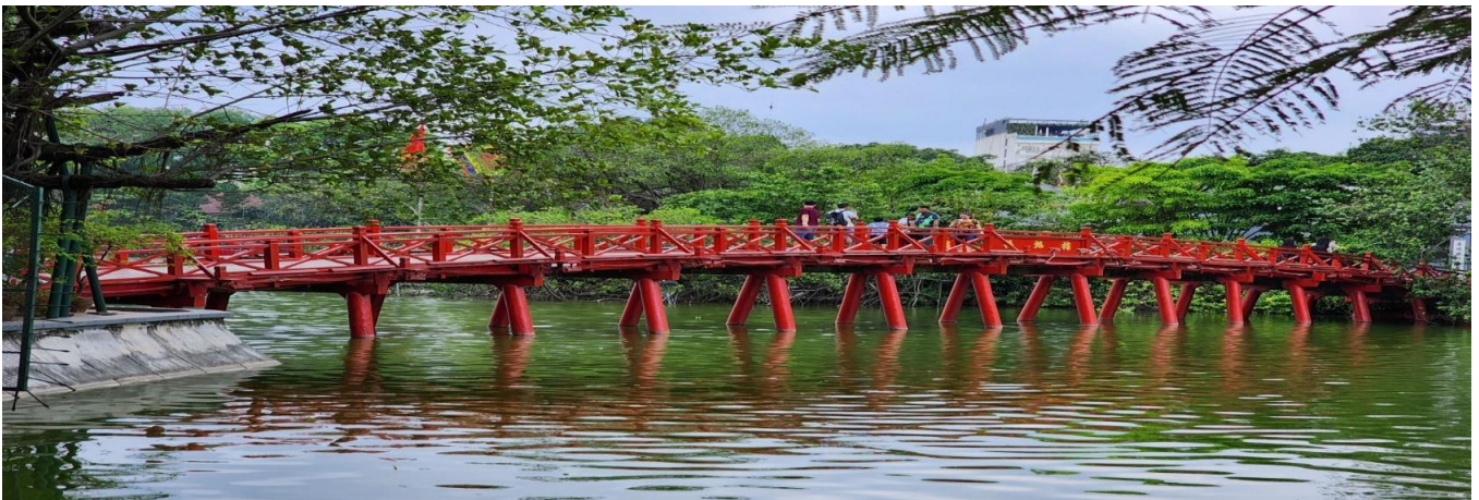
GOTCNXHAN-FD003 - ใบแยกกันแต่ละ บัตรชม...เขยตนามเหยย ซานอย ซาบา...พิชชยอชซา...พานชบน 4 วัณ 3 ทัณ (FD)

จากนั้นนำท่านชม ทะเลสาบคินดาบ ซึ่งเป็นทะเลสาบใจกลางกรุงसानอย มักมีชาวसानอยและนักท่องเที่ยวมานั่งพักผ่อนบริเวณริมทะเลสาบแห่งนี้ นำท่าน สะพานแสงอาทิตย์ (ถ่ายรูปจากด้านนอก) ซึ่งเป็นสะพานไม้สีแดงสดใส เป็นจุดถ่ายรูปที่นักท่องเที่ยวที่มาसानอยมาถ่ายรูปกันมากที่สุด