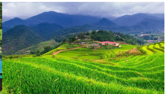
GO1CNXHAN-FD003 ไปเช้ากันเถอะ มินตรง..เวียดนามเหนือ ฮานอย ซาปา ..พิชิตยอดเขา..ฟานซีปัน 4 วัน 3 คืน (FD)

ชำระเงินผ่าน บริษัท ลูกหมู ทราเวล จำกัด เท่านั้น!