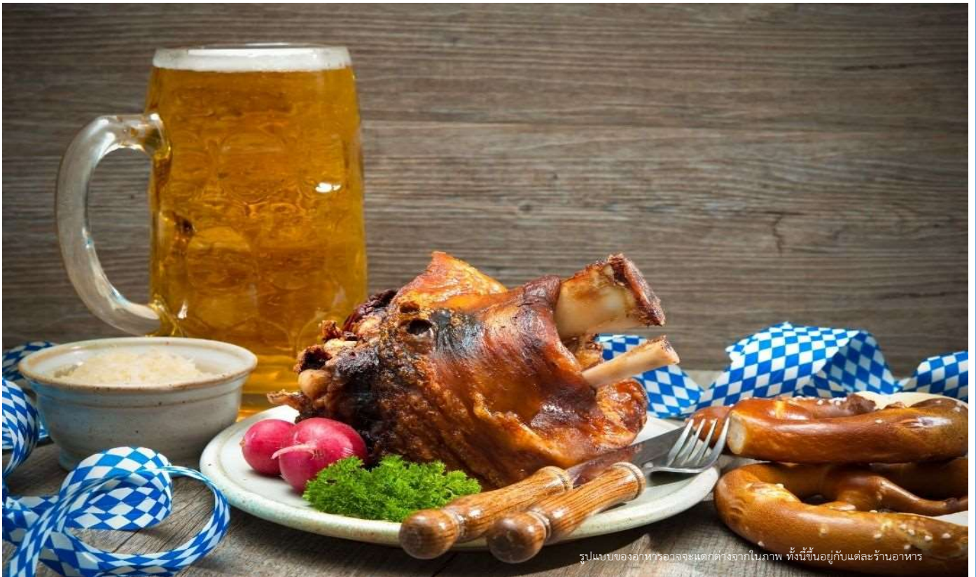
รูปแบบของอาหารอาจจะแตกต่างจากในภาพ ทั้งนี้ขึ้นอยู่กับแต่ละร้านอาหาร

📍 บริการอาหารค่ำ ณ ภัตตาคาร **เมนูพิเศษขาหมูเยอรมันต้นตำหรับ** นำท่านเข้าสู่ที่พัก 🏨 NH Munich Messe Hotel หรือเทียบเท่า