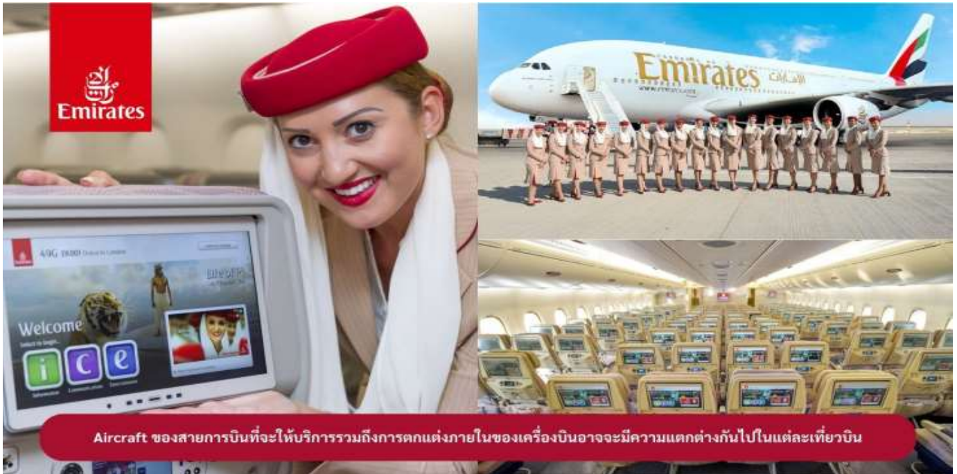
Aircraft ของสายการบินที่จะให้บริการรวมถึงการตกแต่งภายในของเครื่องบินอาจจะมีความแตกต่างกันไปในแต่ละเที่ยวบิน

22.00 น. !!!! คณะเดินทางพร้อมกัน ณ สนามบินสุวรรณภูมิ อาคารผู้โดยสารขาออกระหว่างประเทศ ชั้น 4 ประตู 9 แถว T สายการบินเอมิเรตส์ แอร์ไลน์ (EK) เจ้าหน้าที่ให้การต้อนรับและอำนวยความสะดวก