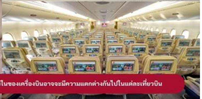
Aircraft ของสายการบินที่จะให้บริการรวมถึงการตกแต่งภายในของเครื่องบินอาจจะมีความแตกต่างกันไปในแต่ละเที่ยวบิน