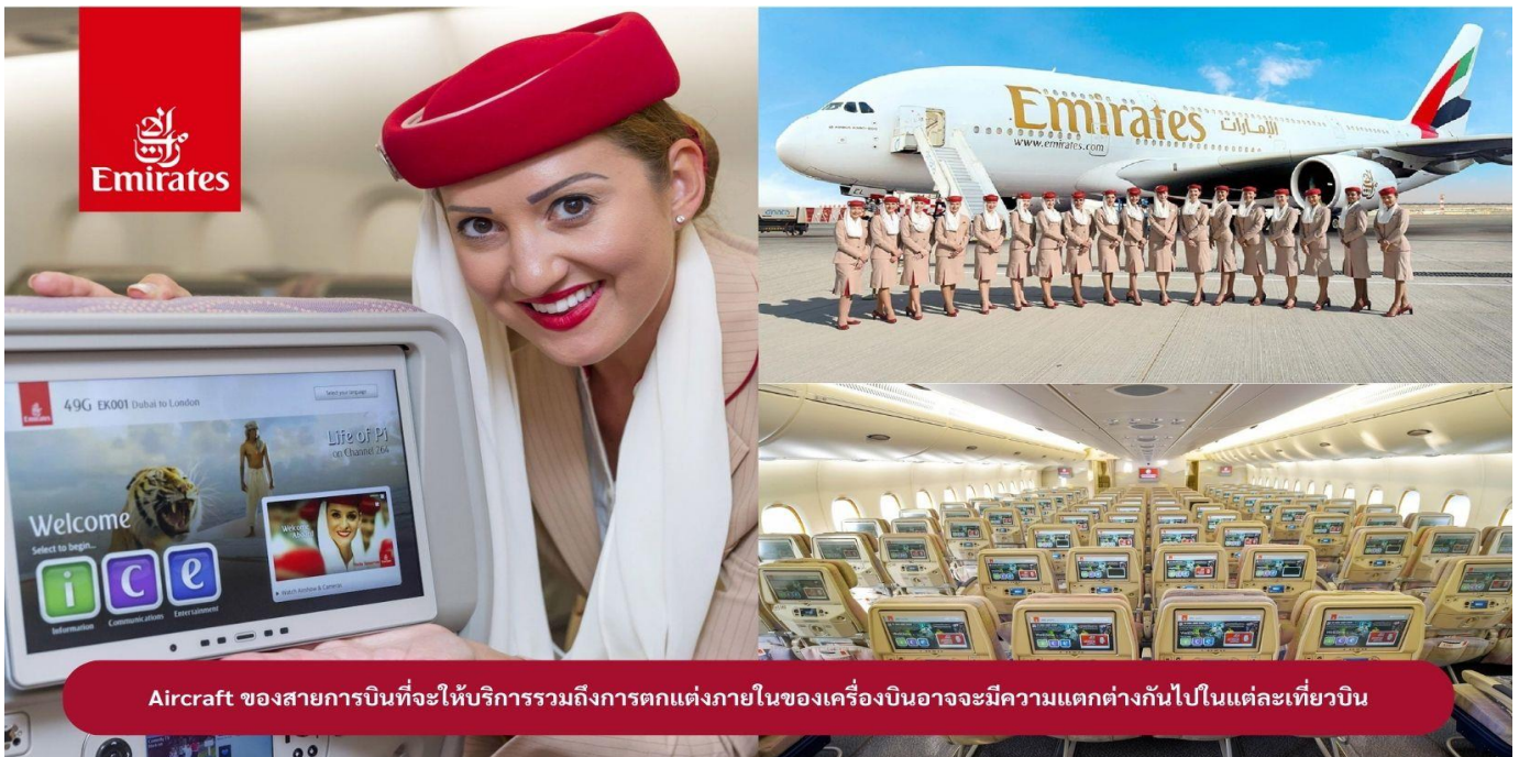
Aircraft ของสายการบินที่จะให้บริการรวมถึงการตกแต่งภายในของเครื่องบินอาจจะมีความแตกต่างกันไปในแต่ละเที่ยวบิน

23.00 น. !!!! คณะเดินทางพร้อมกัน ณ สนามบินสุวรรณภูมิ อาคารผู้โดยสารขาออกระหว่างประเทศ ชั้น 4 ประตู 9 แถว T สายการบินเอมิเรตส์ แอร์ไลน์ (EK) เจ้าหน้าที่ให้การต้อนรับและอำนวยความสะดวก