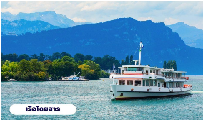
เรือโดยสาร

📍 บริการอาหารเช้า ณ ห้องอาหารของโรงแรม จากนั้นนำท่านเดินทางสู่ ยอดเขาริกิ (Rigi Kulm) โดยใช้การเดินทางโดยเรือจากทะเลสาบลูเซิร์นไปยังท่าเรือวิทซ์เนา (Vitzanu) จากนั้นนั่งรถไฟใต้เขา Rigi ถือได้ว่าเป็นรถไฟใต้เขาที่เก่าแก่ที่สุดในยุโรป และยังเป็นอันดับ 2 รองจากยอดเขาวอชิงตัน ในมลรัฐนิวแฮมป์เชียร์ สหรัฐอเมริกา ความสูงจากระดับน้ำทะเล 1,797 เมตร จนมาถึงยอดเขาริกิ (Rigi Kulm) ซื่อนี้มีที่มาจากคำว่า Mons Regina แปลได้ว่าราชินีแห่งภูเขา เพราะสามารถมองเห็นทิวทัศน์ของยอดเขาอื่นๆ ได้รอบ 360 องศา ชมวิวแบบพาโนรามาโอบล้อมด้วยธรรมชาติของทะเลสาบ Luzern และ Zug อิสระทุกท่านถ่ายรูปชมวิวตามอัธยาศัย