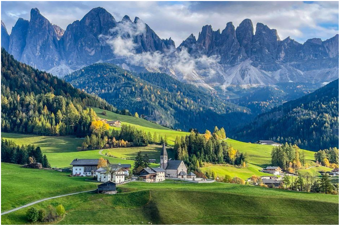
วันที่ห้า ทะเลสาบคาเรซซา-เมืองมิลาน